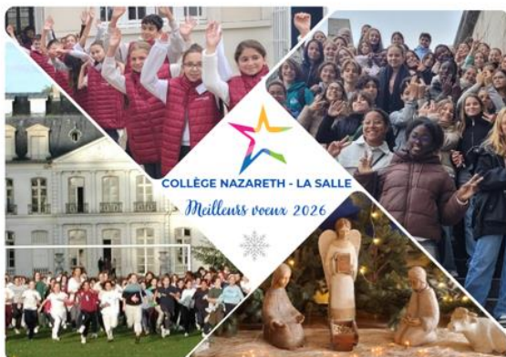
COLLÈGE NAZARETH - LA SALLE Meilleurs vœux 2026

« Noël est la joie, la joie religieuse, une joie intérieure de lumière et de Paix » Pape François